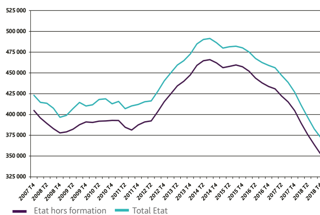
Graphique 2 DEMANDEURS D'EMPLOI INDEMNISÉS PAR TRIMESTRE AU TITRE D'ALLOCATIONS D'ÉTAT