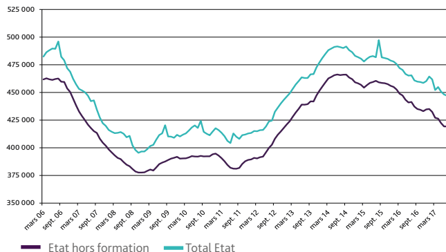
Graphique 2 DEMANDEURS D'EMPLOI INDEMNISÉS EN FIN DE MOIS AU TITRE D'ALLOCATIONS D'ÉTAT

Données CVS, France métropolitaine