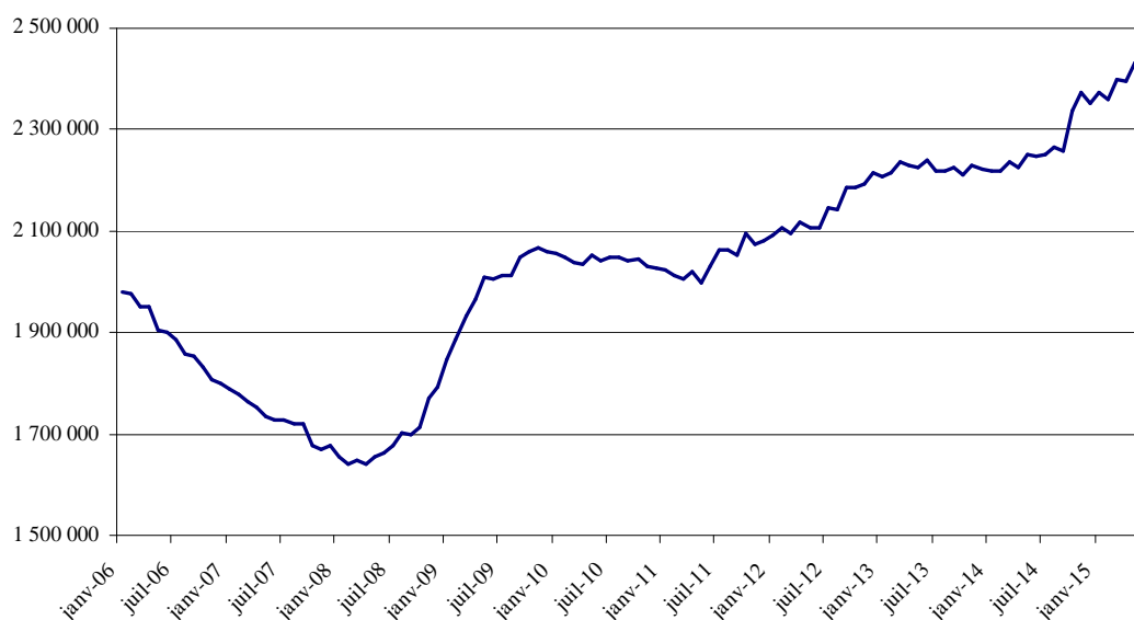
Demandeurs d'emploi indemnisés en fin de mois au titre de l'Assurance chômage (hors formation)

Les bénéficiaires de l'Assurance chômage représentent 77,2% des personnes indemnisées en juin 2015.