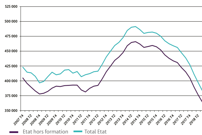
Graphique 2 DEMANDEURS D'EMPLOI INDEMNISÉS PAR TRIMESTRE AU TITRE D'ALLOCATIONS D'ÉTAT